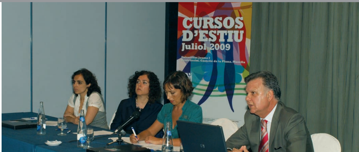
El gerente (derecha), se dirige a los asistentes en compañía de la directora de los cursos de verano y de otras dos ponentes.