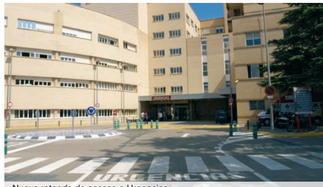
Nueva rotonda de acceso a Urgencias

El Hospital General de Castell3 no se ha tomado vacaciones a la hora de mejorar la atenci3n al paciente y a los usuarios de los servicios hospitalarios. Para ello ha destinado m s de 813.000 euros en infraestructuras y equipamientos tanto para el propio complejo hospitalario como para los servicios sanitarios.