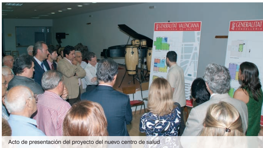
Acto de presentación del proyecto del nuevo centro de salud

"Y ese es el espíritu que tenemos, el de seguir trabajando por la ciudadanía y mejorar la calidad de vida de las y los castellonenses, con nuestra dotaciones con el fin de que los vecinos estén bien atendidos", remarcó Alberto Fabra, quien agradeció el esfuerzo de la Conselleria de Sanidad por llevar adelante este proyecto en beneficio de la ciudadanía. ■