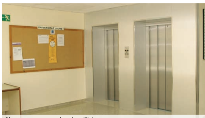
Nuevos ascensores de este edificio anexo