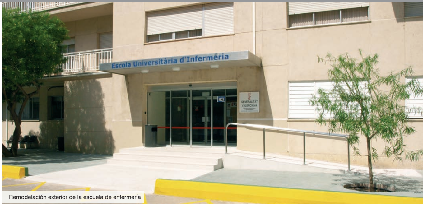
Remodelaci3n exterior de la escuela de enfermeria