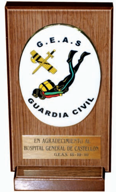
La Guardia Civil de Valdemoro agradeció la buena praxis y la colaboración recibida por el centro sanitario castellanense y el persona de la UTH.

Es la primera vez que se realiza en España un Curso de Operadores de Cámaras Hiperbáricas para Enfermería, y se ha hecho con el programa de la European Baromedical Association que permite su convalidación en la UE, lo que fue un motivo más de satisfacción para los asistentes. ■